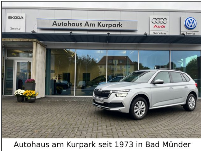
Autohaus am Kurpark seit 1973 in Bad Münder

Auftragsnummer: 378004019 SUV/Geländewagen Gebrauchtwagen EZ: 10/2022 14.500 km Benzin 81 kW (110 PS) 999 ccm Schaltgetriebe Farbe: Silber Innen: Stoff